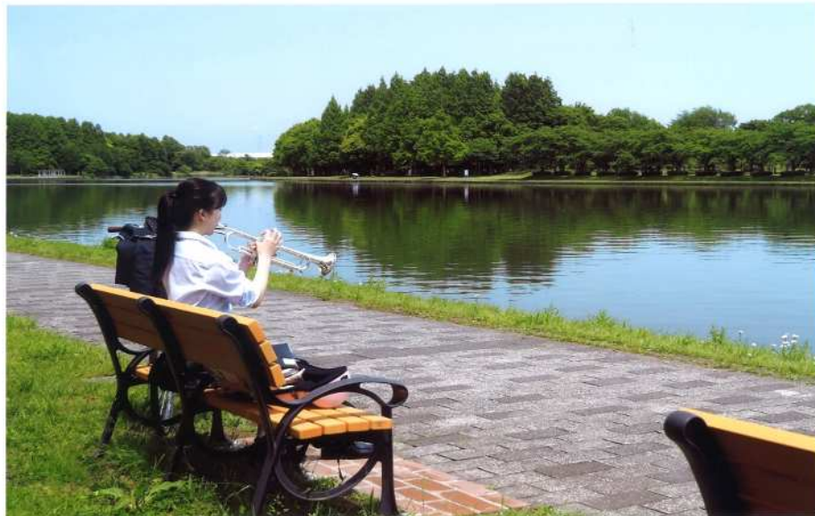
「湖畔に響く音色」 (撮影場所：水元公園)