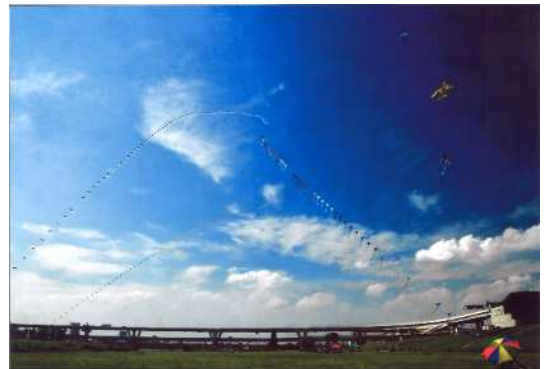
「凧々あがれ」 (撮影場所：堀切水辺公園)