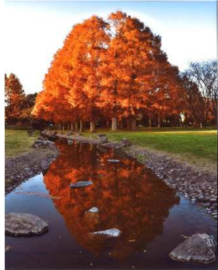
「秋絶好調」 (撮影場所：水元公園)