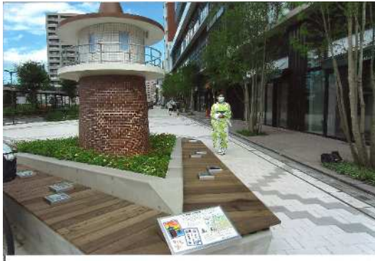
「待ち合わせスポット」 (撮影場所：金町駅南口)