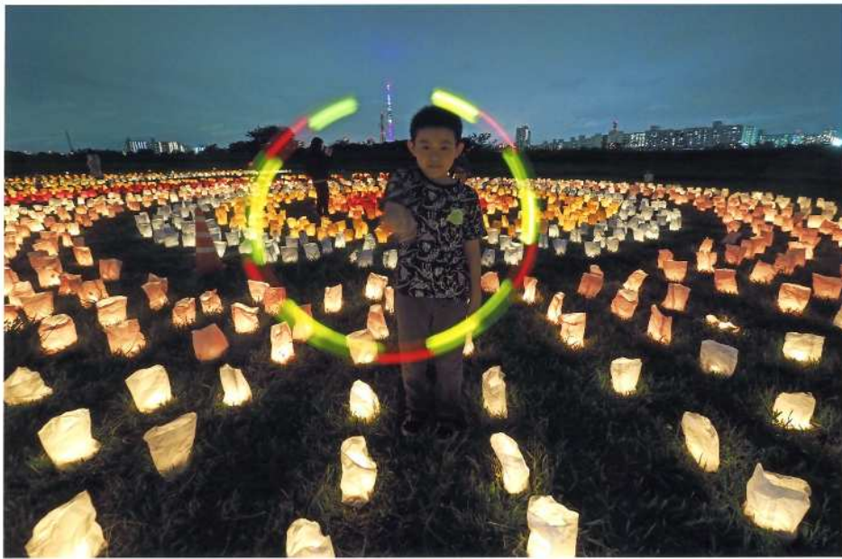
「マジックショー」(撮影場所：堀切水辺公園)