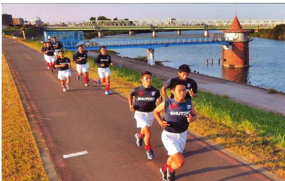
「ランニングロード」(撮影場所：金町浄水場付近)