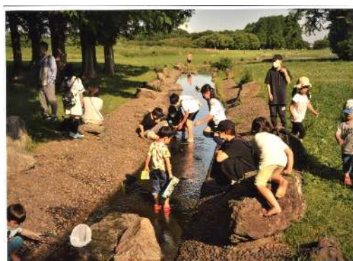
「子供の広場」 (撮影場所：水元公園)