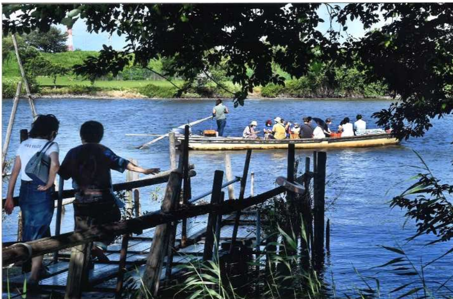
「いってしまった！」(撮影場所：矢切の渡し)