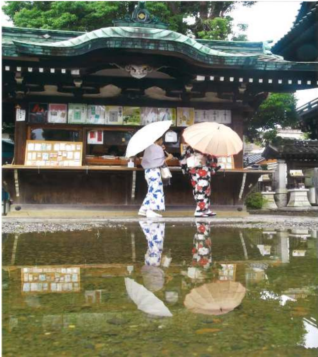
「素敵な雨上り」(撮影場所：柴又帝釈天)