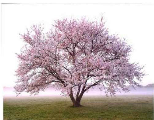
「霧中の桜」 (撮影場所：水元公園)