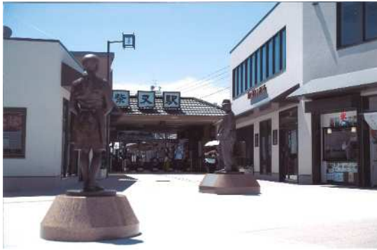
「変わらぬ思い」 (撮影場所：柴又駅前)