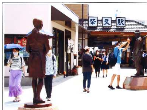
『「さくら、駅前広場いいもんだねー」』 (撮影場所：柴又駅前)