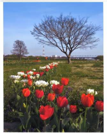
「春の訪れ」 (撮影場所：柴又公園)