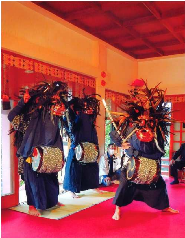
「太刀の舞」(撮影場所：柴又八幡神社)