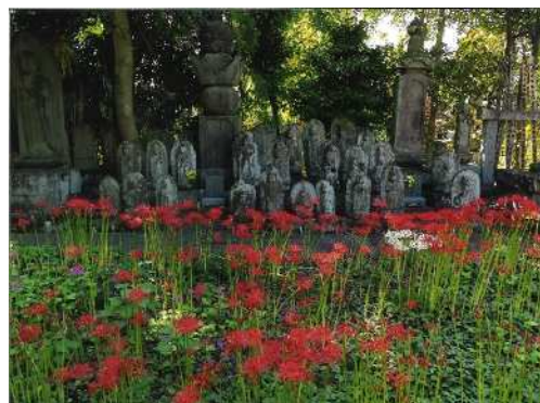
「静謐の彼岸花」 (撮影場所：宝蔵院)